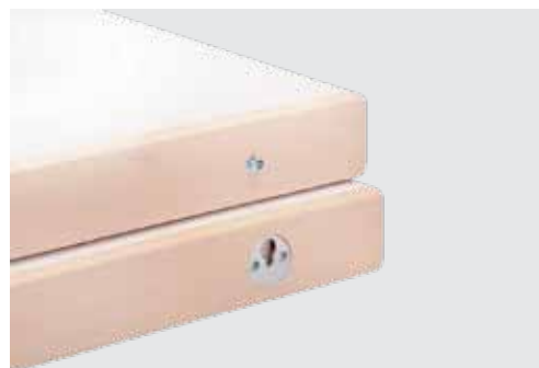
Verbindung Einhängeplatten connection of intermediate table tops