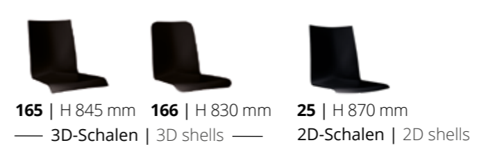
165 | H 845 mm